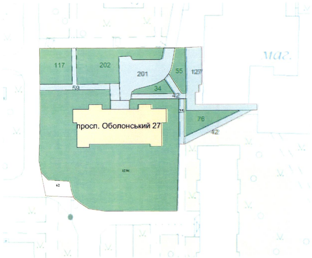
СХЕМА обслуговування території навколо багатоквартирного будинку на просп. Оболонському, 27

Додаток 6 до Договору про надання послуги з управління багатоквартирним будинком від 07.02.2025 № 457