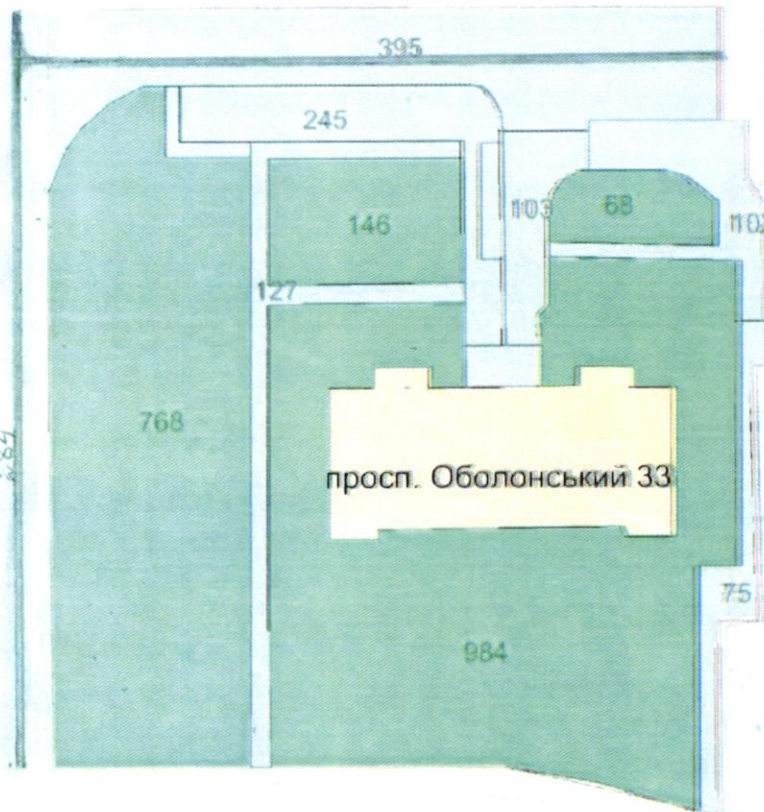
СХЕМА обслуговування території навколо багатоквартирного будинку на просп. Оболонському, 33

Додаток 6 до Договору про надання послуги з управління багатоквартирним будинком від 07.02.2025 № 465