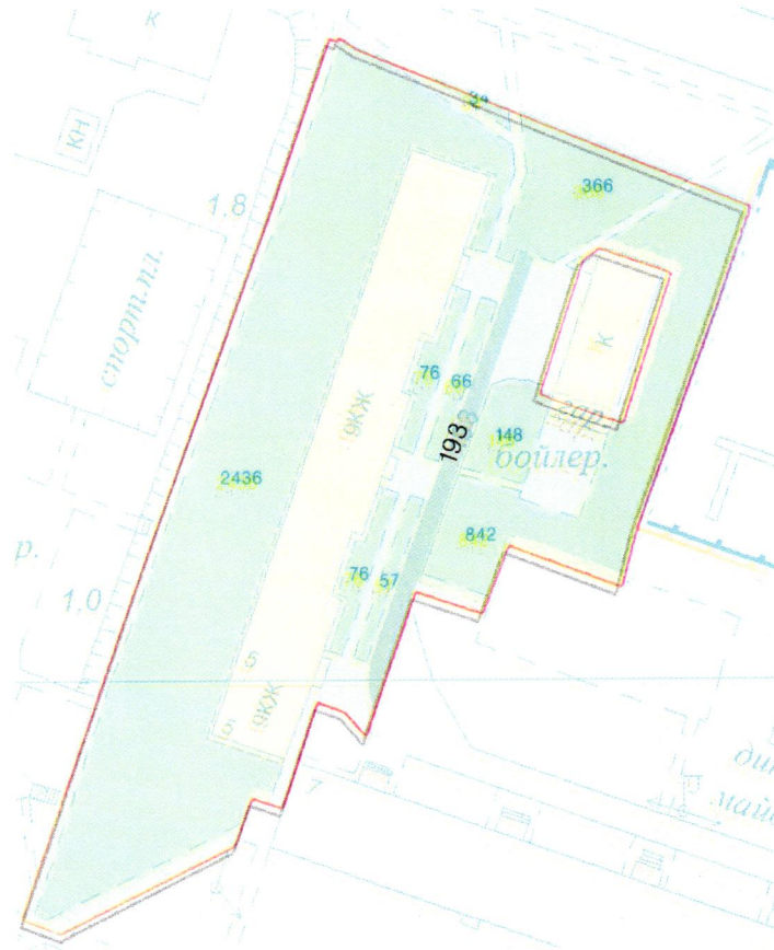
СХЕМА обслуговування території навколо багатоквартирного будинку на вул. Полярній, 5

Додаток 6 до Договору про надання послуги з управління багатоквартирним будинком від 07.08.2025 № 521