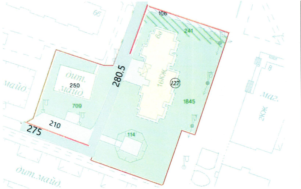
СХЕМА обслуговування території навколо багатоквартирного будинку на вул. Полярній, 6-В

Додаток 6 до Договору про надання послуги з управління багатоквартирним будинком від 07.02.2025 № 523