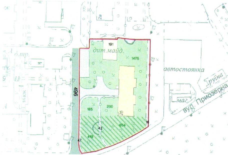
СХЕМА обслуговування території навколо багатоквартирного будинку на вул. Приозерній, 2-Б

Додаток 6 до Договору про надання послуги з управління багатоквартирним будинком від 07.02.2025 № 548