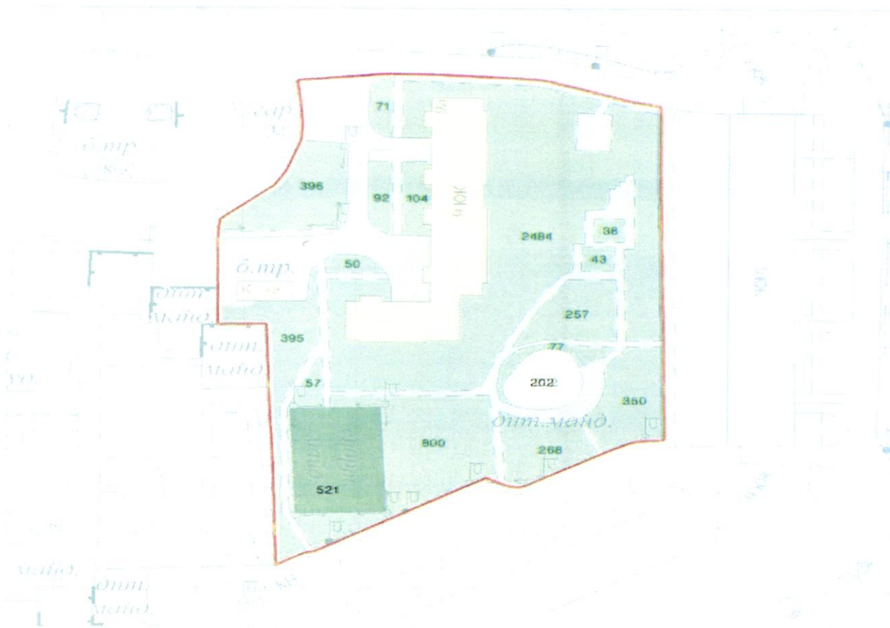
СХЕМА обслуговування території навколо багатоквартирного будинку на вул. Прирічна, 9-А

Додаток 6 до Договору про надання послуги з управління багатоквартирним будинком від 07.02.2025 № 555