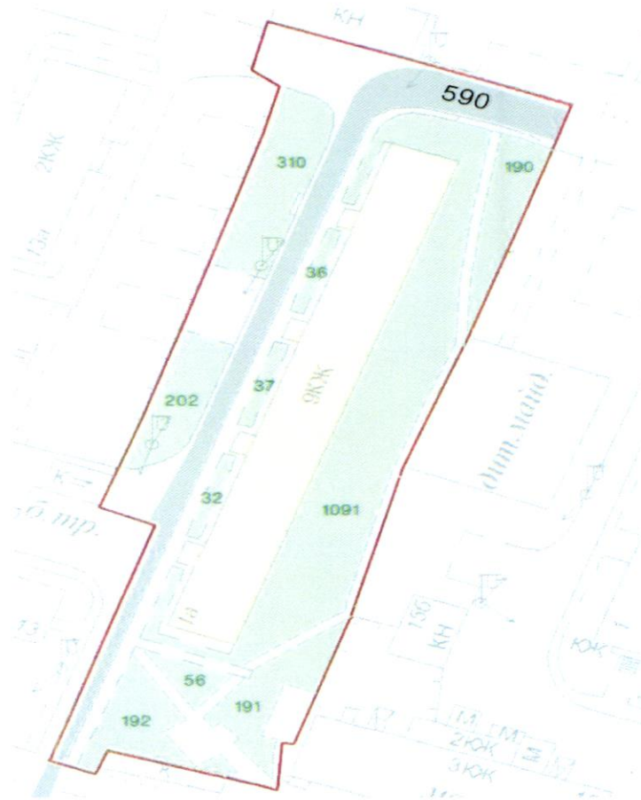
СХЕМА обслуговування території навколо багатоквартирного будинку на вул. Петра Калнишевського, 1-А

Додаток 6 до Договору про надання послуги з управління багатоквартирним будинком від 04.02.2025 № 312