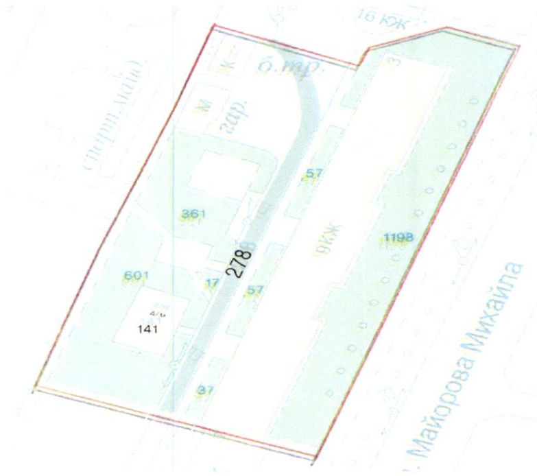
СХЕМА обслуговування території навколо багатоквартирного будинку на вул. Петра Калнишевського, 3

Додаток 6 до Договору про надання послуги з управління багатоквартирним будинком від 08.02.2025 № 314