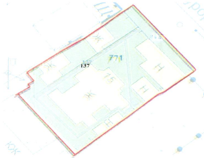
СХЕМА обслуговування території навколо багатоквартирного будинку на вул. Курортній, 15-А

Додаток 6 до Договору про надання послуги з управління багатоквартирним будинком від 07.08.2025 № 342