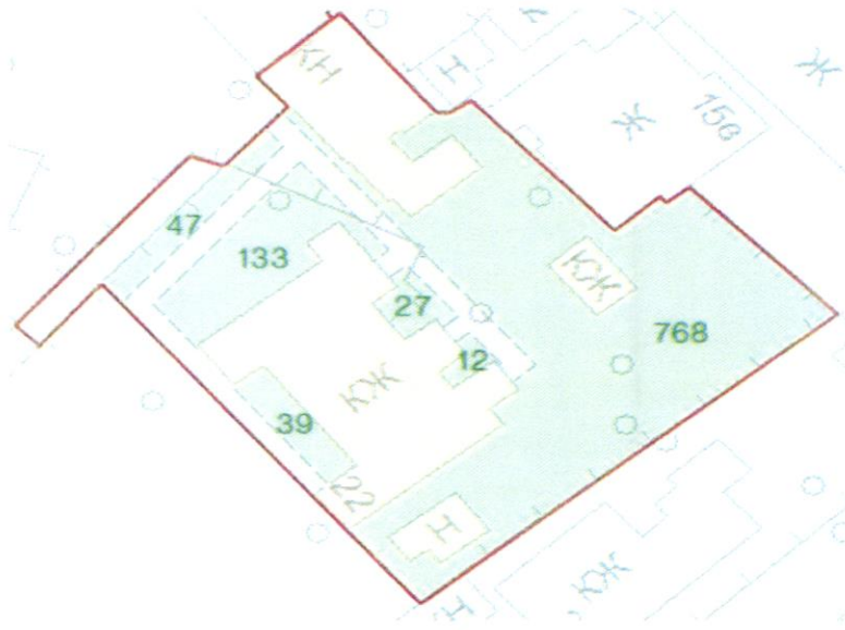
СХЕМА обслуговування території навколо багатоквартирного будинку на вул. Курортній, 22

до Договору про надання послуги з управління багатоквартирним будинком від 07.02.2025 № 843