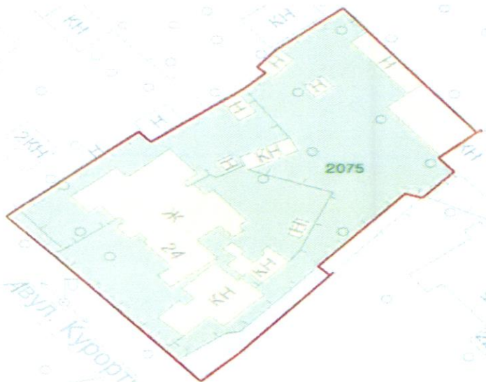
СХЕМА обслуговування території навколо багатоквартирного будинку на вул. Курортній, 24

до Договору про надання послуги з управління багатоквартирним будинком від 07.02.2025 № 344