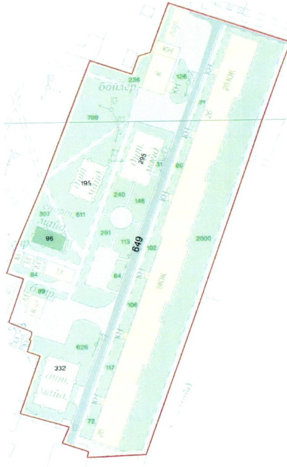
СХЕМА обслуговування території навколо багатоквартирного будинку на просп. Маршала Рокоссовського, 2-Б

до Договору про надання послуги з управління багатоквартирним будинком від 07.02.2025 № 568