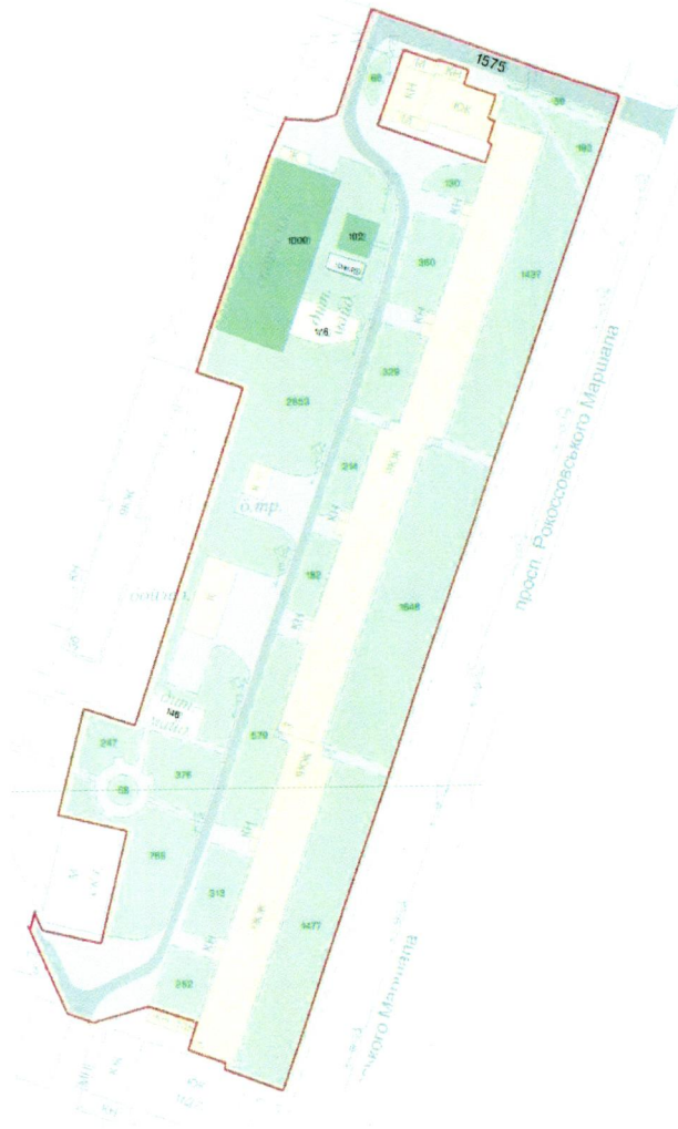
СХЕМА обслуговування території навколо багатоквартирного будинку на просп. Маршала Рокоссовського, 3

до Договору про надання послуги з управління багатоквартирним будинком від 04.02.2025 № 540