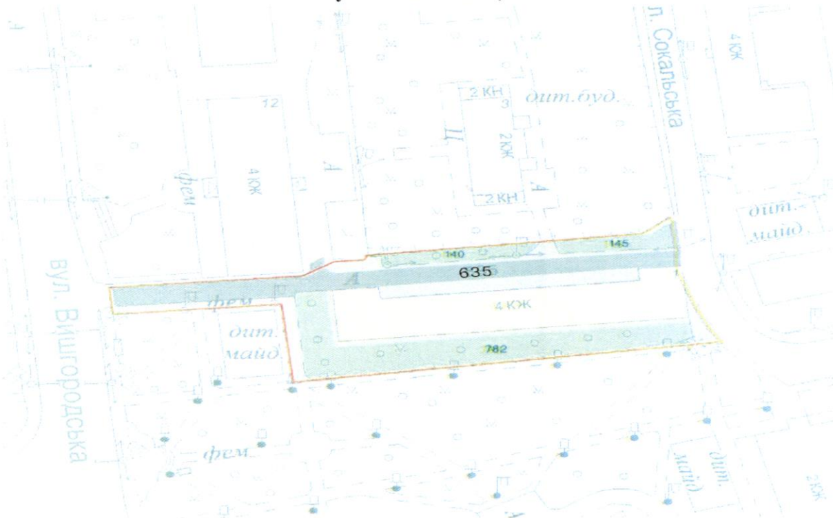
СХЕМА обслуговування території навколо багатоквартирного будинку на вул. Сокальській, 1

до Договору про надання послуги з управління багатоквартирним будинком від 07.02.2025 № 582