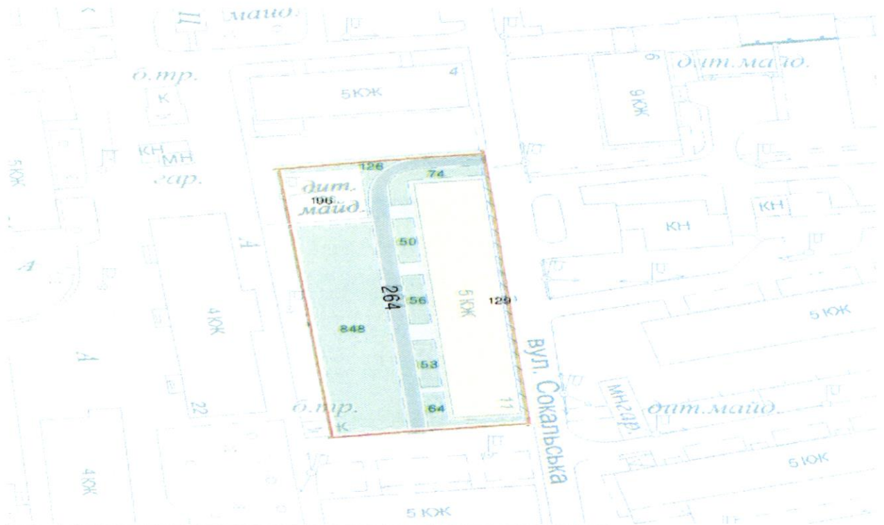
СХЕМА обслуговування території навколо багатоквартирного будинку на вул. Сокальській, 11

до Договору про надання послуги з управління багатоквартирним будинком від 07.08.2025 № 586