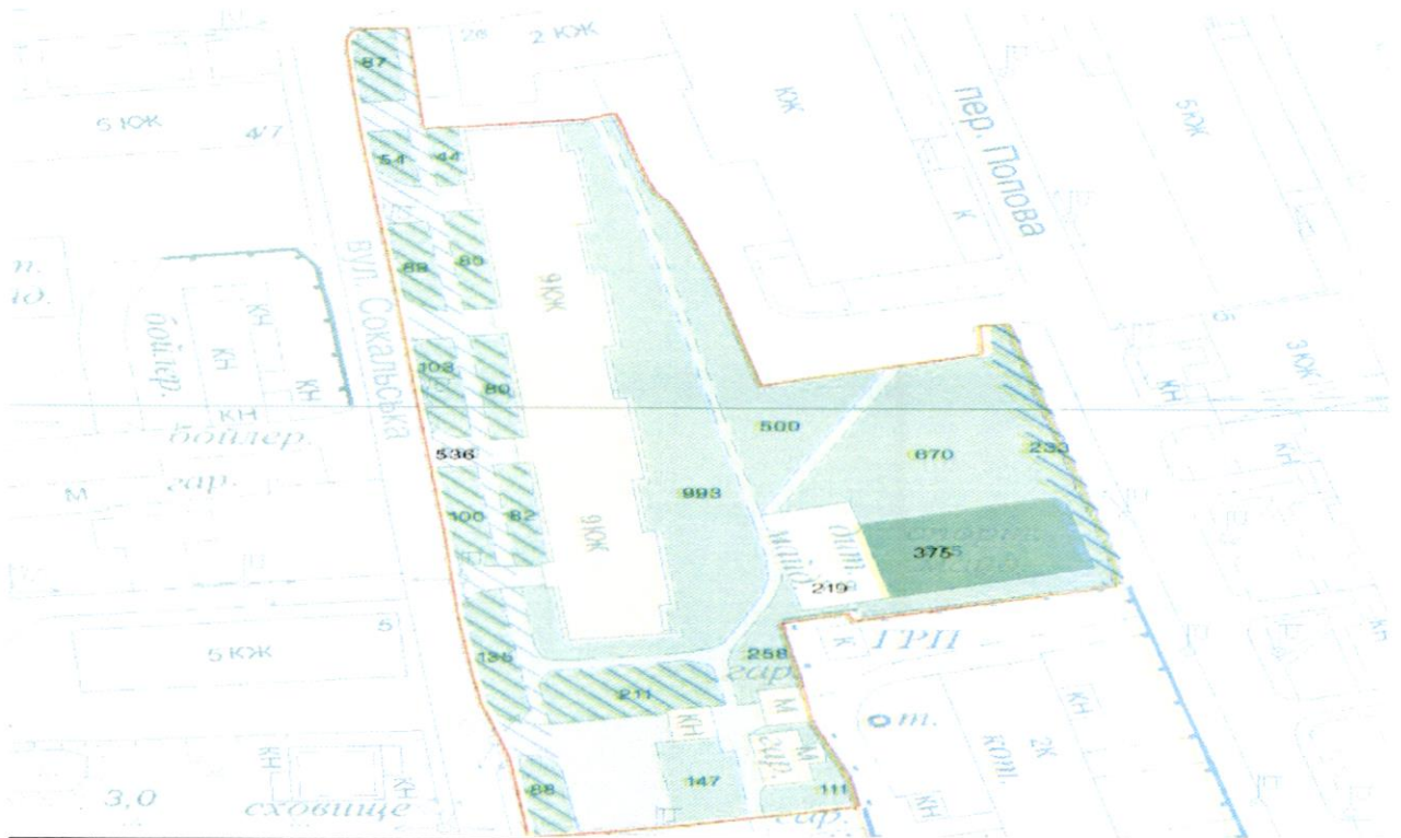
СХЕМА обслуговування території навколо багатоквартирного будинку на вул. Сокальській, 6

до Договору про надання послуги з управління багатоквартирним будинком від 07.02.2025 № 585