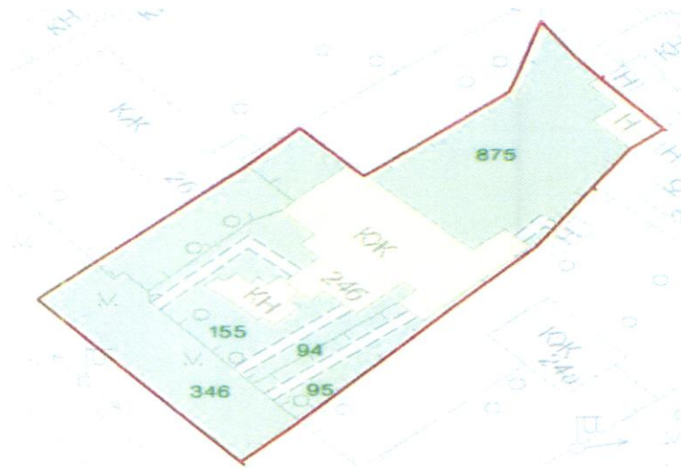
СХЕМА обслуговування території навколо багатоквартирного будинку на вул. Квітки Цісик, 24-Б

Додаток 6 до Договору про надання послуги з управління багатоквартирним будинком від 07.02.2025 № 3/6