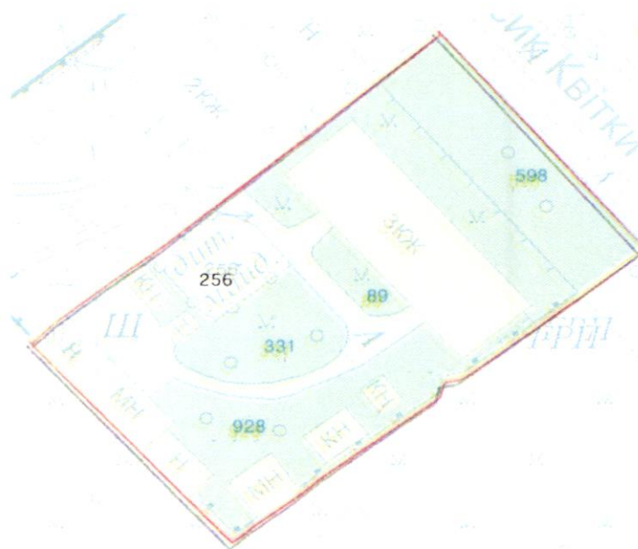
СХЕМА обслуговування території навколо багатоквартирного будинку на вул. Квітки Цісик, 51-А

Додаток 6 до Договору про надання послуги з управління багатоквартирним будинком від 04.02.2025 № 325