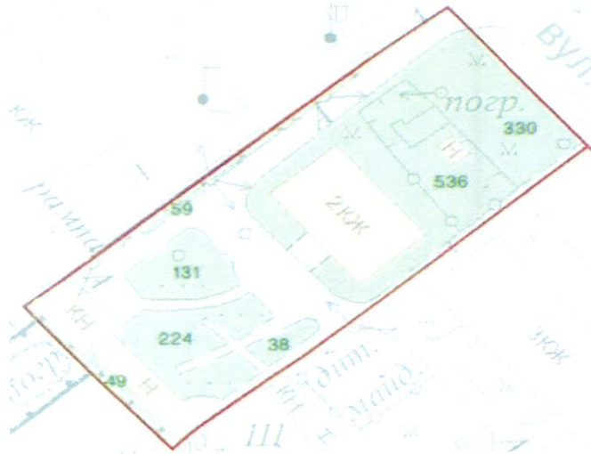
СХЕМА обслуговування території навколо багатоквартирного будинку на вул. Квітки Цісик, 53

Додаток 6 до Договору про надання послуги з управління багатоквартирним будинком від 07.02.2025 № 826