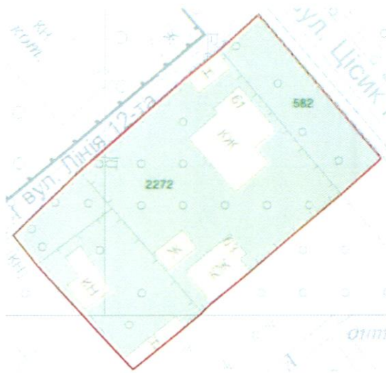
СХЕМА обслуговування території навколо багатоквартирного будинку на вул. Квітки Цісик, 61

Додаток 6 до Договору про надання послуги з управління багатоквартирним будинком від 07.07.2025 № 324